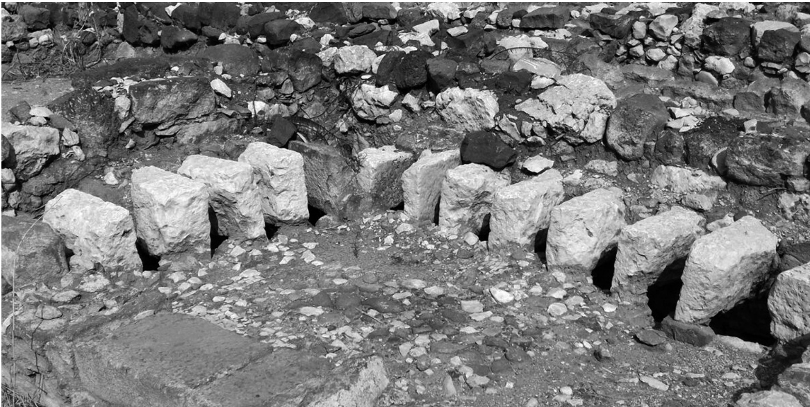
Vista parcial de los restos de las letrinas públicas adyacentes a los baños.

Este es un dato significativo, porque los de Magdala son los únicos baños públicos de época asmonea conocidos en Palestina 19 . Más aún, en la remodelación de estos baños, que tuvo lugar en el período romano tardío, se construyeron unas letrinas públicas que son también un caso singular no solo en Palestina, sino en todo el oriente romano, donde la satisfacción de estas necesidades fisiológicas era una cuestión más privada y menos social que en la parte occidental del Imperio 20 .