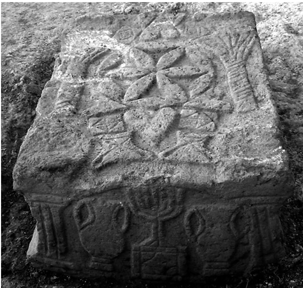
Piedra tallada con imágenes alusivas al Templo hallada en la sinagoga.

nografía de la misma hace referencia al Templo de Jerusalén 21 . Este dato confirma que la identidad hebrea de Magdala quedó definida y profundamente marcada por la ideología asmonea, en la que el Templo de Jerusalén ocupaba un lugar central 22 .