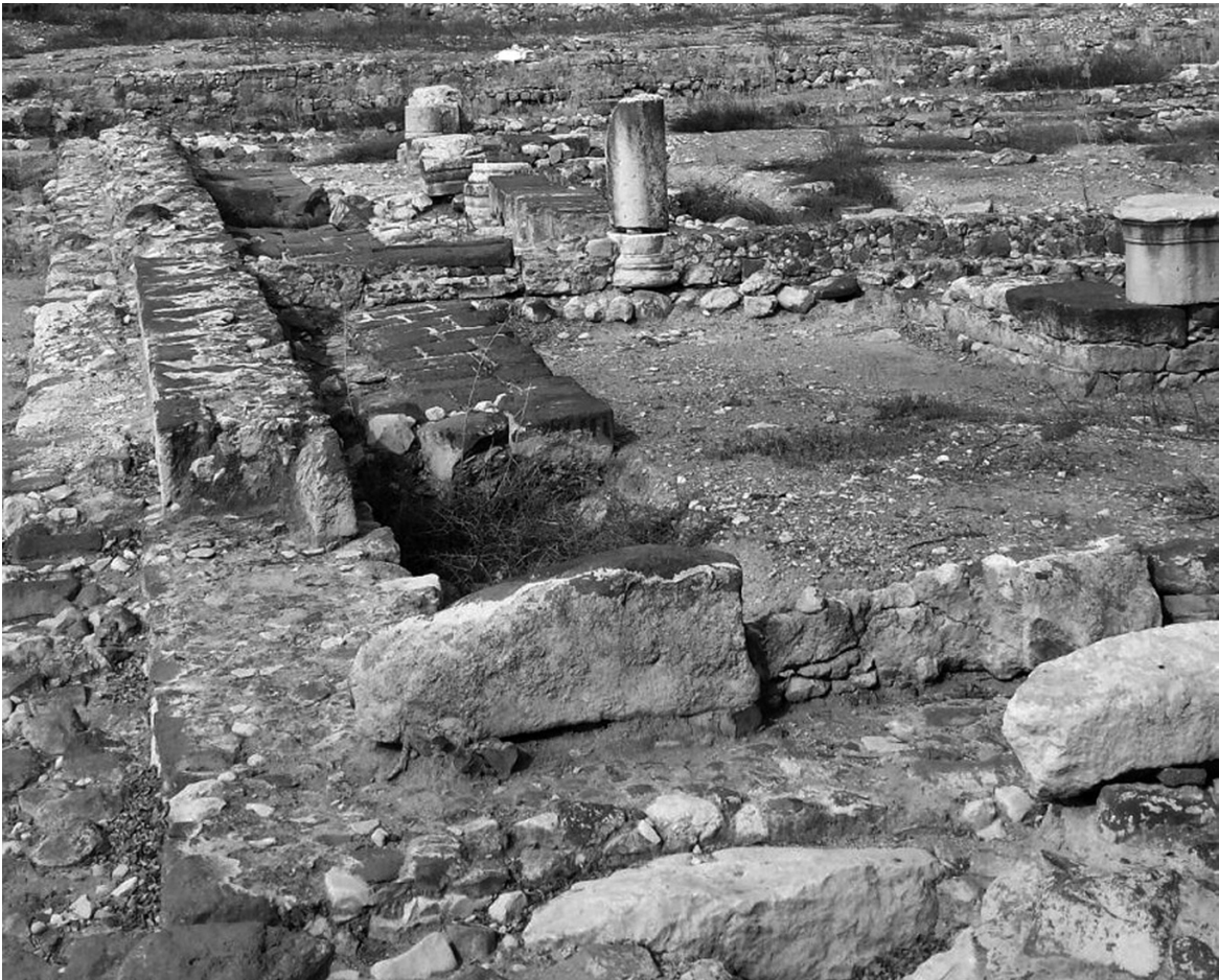
Vista parcial de la esquina sureste del quadriporticus .

El trazado urbano revela que fue cuidadosamente planificada. Tenía una estructura ortogonal, con calles rectas que formaban la retícula característica de las ciudades helenísticas y romanas. El cardo o calle principal discurría en dirección norte sur y formaba parte de la calzada que bordeaba la orilla occidental del lago 6 . Paralelamente a ella había otras calles, todas ellas atravesadas transversalmente por una serie de decumani que discurrían en dirección oeste este y llegaban hasta la orilla del lago. Esta estructura urbana, que es perfectamente visible en las zonas que han sido excavadas, aparece también en las exploraciones preliminares realizadas al norte de las mismas. Dichas exploraciones revelan que la ciudad llegó a tener una extensión considerable en los inicios del período romano.