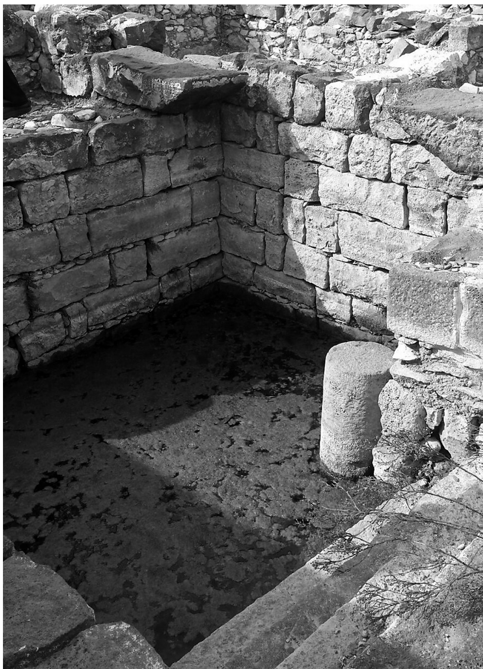
Vista de una de las piscinas del complejo de los baños públicos.

El plano de la ciudad revela ya, como hemos visto, una asimilación a los usos urbanísticos de la cultura helenística. Del mismo modo, edificios tan emblemáticos como los baños, que fueron construidos durante la época asmonea según el modelo griego de los balaneia , y fueron ampliados y remodelados en tiempos de Agripa II siguiendo el modelo de las thermae romanas, son un claro indicio de la asimilación a la cultura helenística y romana.