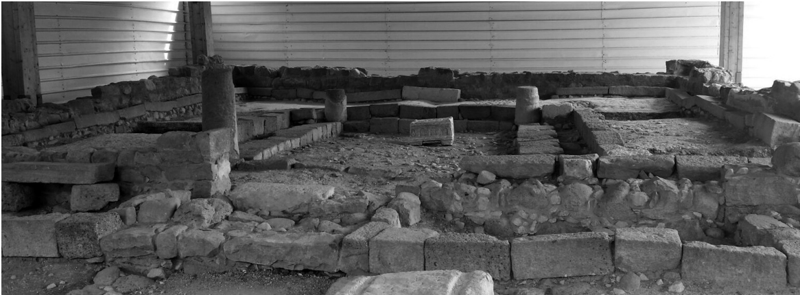
Restos de la sinagoga, con una reproducción de la piedra encontrada en ella en el centro.

Cerca de la sinagoga se han descubierto unas estructuras que podrían estar relacionadas con el procesamiento de pescado, que era la industria más característica de la ciudad. Estas estructuras parecen estar vinculadas a otro tramo del complejo portuario identificado en la zona sur.