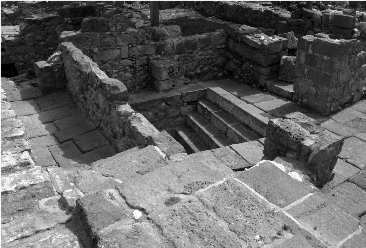
Estructuras de una casa acomodada de Magdala.

El contraste entre la localización social de quienes vivían en los barrios más acomodados de Magdala y los transmisores y destinatarios del “Documento Q” nos proporciona dos puntos de vista complementarios sobre la Galilea del siglo I. Aunque es aventurado, resulta tentador relacionarlos, situando a estos últimos en el grupo de los funcionarios que hacían de intermediarios entre las familias de la élite y los estratos inferiores de la población. Si esta identificación es acertada, podríamos afirmar que los miembros del grupo de Q tenían una posición privilegiada para llevar a cabo un proyecto de renovación social 51 .