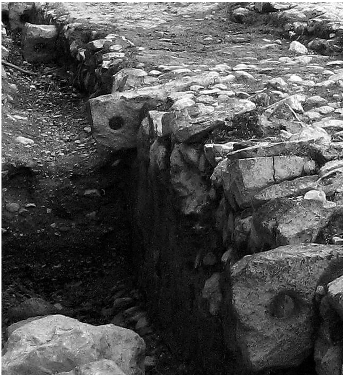
Detalle de las piedras de atraque de la zona sur del puerto de Magdala.

atención, pues la mayoría de los puertos eran entonces mucho más rudimentarios 27 .