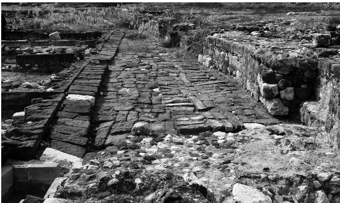
El cardo o calle principal de la ciudad a su paso por la plaza porticada.

Las excavaciones realizadas en Magdala nos han revelado cuáles fueron sus orígenes y cuál fue su evolución en tiempos de los gobernantes asmoneos y herodianos. Aunque hay indicios de que durante el período helenista hubo allí algún tipo de asentamiento, las estructuras urbanas y los principales edificios son de época asmonea. La fundación de la ciudad coincide, de hecho, con el comienzo del dominio asmoneo en Galilea 5 .