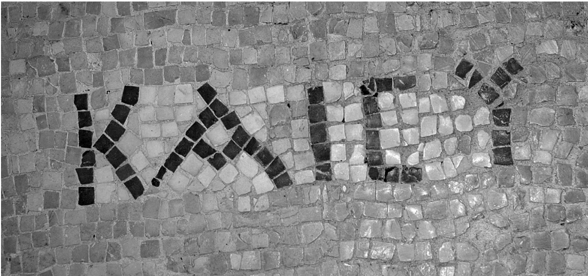
Inscripción en griego hallada en el mosaico que daba acceso a los baños.

La principal objeción planteada en los últimos años contra la localización de Q en Galilea es el hecho de que este documento parece haber sido compuesto en griego. El uso de la lengua griega en Galilea sigue siendo una cuestión debatida, pero las inscripciones demuestran claramente que se usaba desde antiguo, y que en el siglo I era utilizada por ciertos estratos de la población como lengua vehicular para la administración y el comercio 45 . Podemos presuponer, por tanto, con la mayoría de los estudiosos, que los recuerdos sobre Jesús reunidos en él reflejan el ambiente galileo.